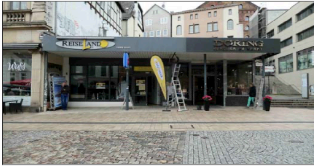
-1- Straßenansicht „Markt“