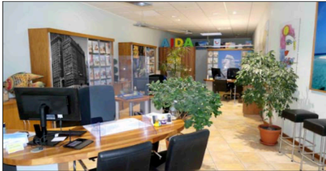
-5- Geschäftsfläche links (Reisebüro)