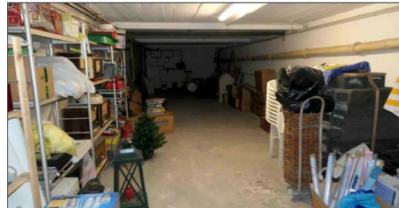
-11- KG Fläche links